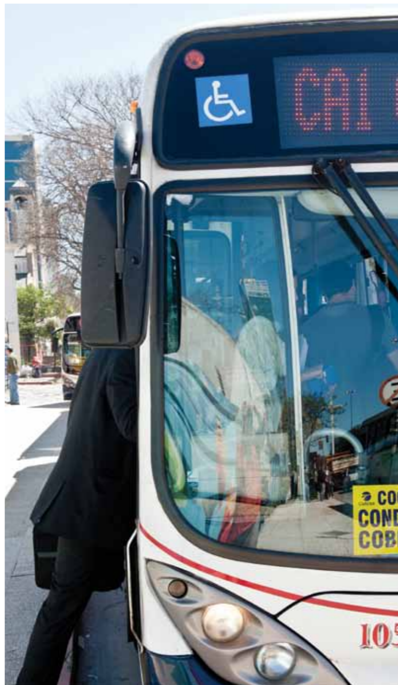
↑ Línea CA1, unidad adaptada para personas con discapacidad.

Esta normativa, que es una de las medidas que se han adoptado para promover la accesibilidad, está sustentada en la concepción sobre la discapacidad que tiene la intendencia, establecida en la Convención Internacional sobre los Derechos de las Personas con Discapacidad, ratificada en Uruguay por la ley 18.418