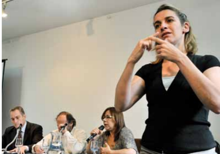
Presentación del Informe País. Autor: Inés Filgueiras/Mides.

Detalla que existen dos ámbitos institucionales donde las personas con discapacidad pueden presentar denuncias por