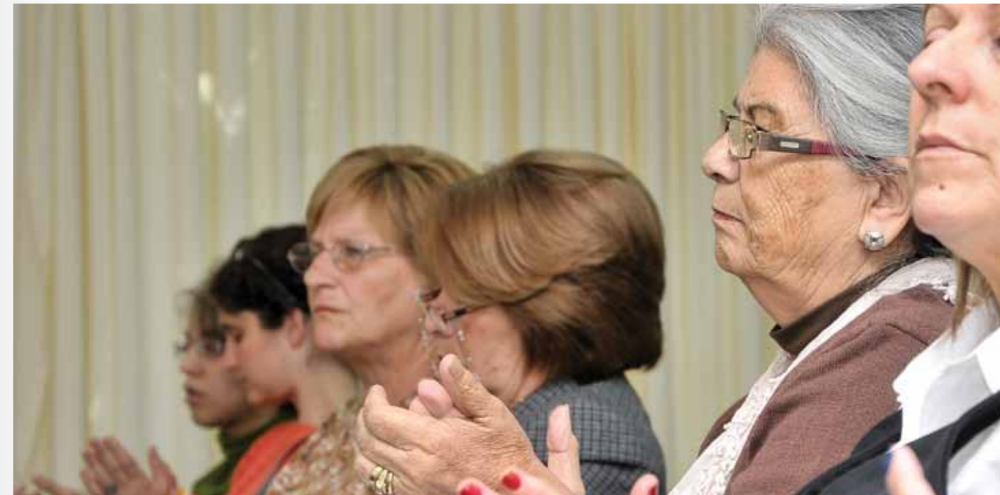
↑ Representantes de organizaciones de personas con discapacidad en la presentación del avance del Informe País.

El material será enviado al comité radicado en Ginebra (Suiza), que recibe los informes de los distintos países que ratificaron la Convención. Probablemente en 2013, una delegación