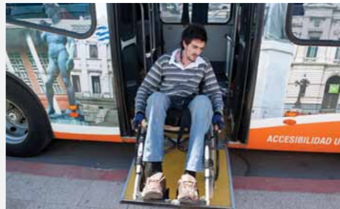
↑ Rampa manual en ómnibus con piso bajo.

Urse explicó a RAMPA que para la proyección de las obras del Plan de Movilidad Urbana se tuvo en cuenta la accesibilidad. Particularmente sobre las obras para el corredor exclusivo de ómnibus en avenida Garzón y las obras de la Terminal Colón, el jerarca aseguró que serán “100% accesibles”: “no hay escaleras en la ter-