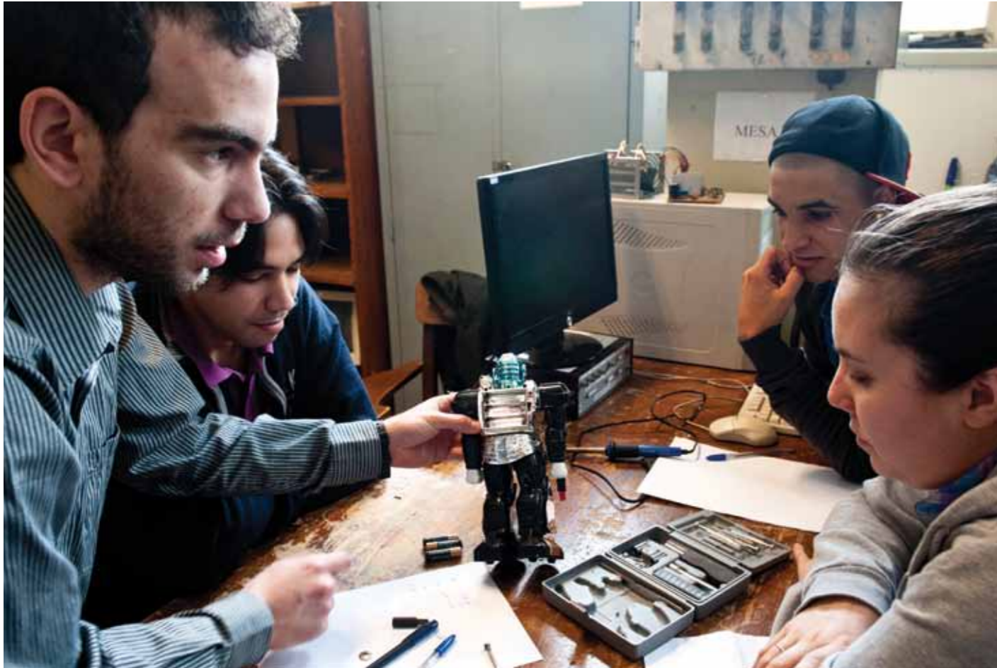
↗ ↘ Padres y representantes de organizaciones sociales participan del taller de ayudas tecnológicas para personas con discapacidad en la Facultad de Ingeniería.

municador de pizarrón para cuatro personas con botones inalámbricos y juguetes adaptados.